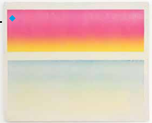
Better day, 2016, acrylique et collage papier sur toile, 60 x 73 cm