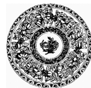
LE BOUCLIER DE BRENNUS