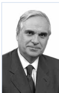
M. le Bâtonnier Jean-Marie Burguburu

42 avenue Montaigne - 75008 Paris Tél. : 01 72 74 03 33 Fax : 01 72 74 03 34 E-mail : pa.iweins@taylorwessing.com