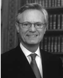
Yves Repiquet Bâtonnier de l'Ordre