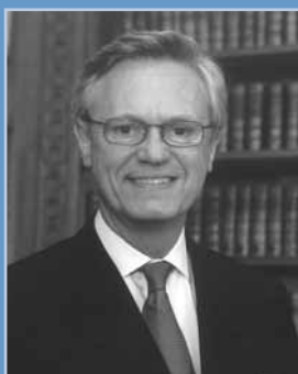
Yves Repiquet Bâtonnier de l'Ordre