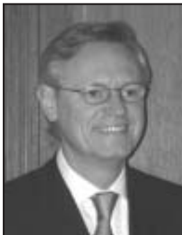
Yves Repiquet Bâtonnier de l'Ordre