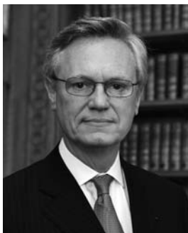
Yves Repiquet Bâtonnier de l'Ordre