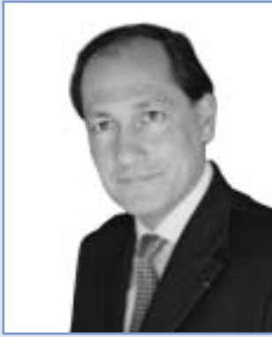
Edouard de Lamaze