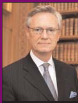
M. Yves Repiquet Bâtonnier de l'Ordre des Avocats de Paris