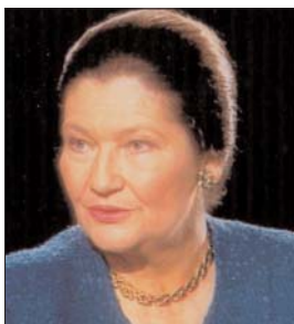
Simone Veil Présidente du Fonds au profit des victimes