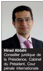
Hiram Abtahi Conseiller juridique de la Présidence, Cabinet du Président, Cour pénale internationale