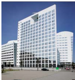
Bâtiment de la CPI