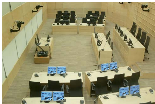
Salle d'audience 1

Avant tout, que le Procureur veille à son indépendance et ne devienne pas un instrument de la politique extérieure des "grands" de ce monde et du Conseil de Sécurité. C'est un danger réel qui menace la Cour.