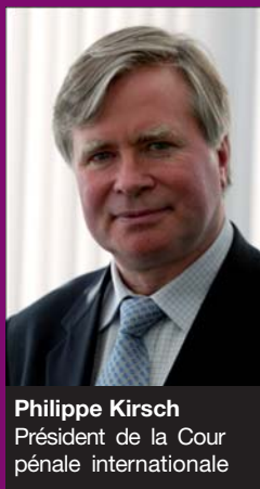
Philippe Kirsch Président de la Cour pénale internationale

Barreau Autour du Monde (ci-après BAM) Philippe Kirsch, vous êtes aujourd'hui le Président de la Cour pénale internationale (CPI) créée par le Statut de Rome pour juger les responsables de génocides, de crimes de guerre ou de crimes contre l'humanité commis à partir du 1 er juillet 2002, date de l'entrée en vigueur du Statut. Auparavant vous avez exercé la fonction de Président du Comité plénier de la Conférence diplomatique de Rome de 1998, qui a adopté le Statut de la CPI. Puis de 1999 à 2002, vous avez également présidé la Commission préparatoire de la Cour. Quels ont été pour vous les événements clés qui ont conduit à la mise en place de la Cour pénale internationale ?